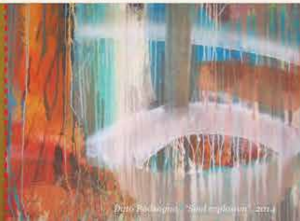
Dato Badzagua, "Soul explosion", 2014