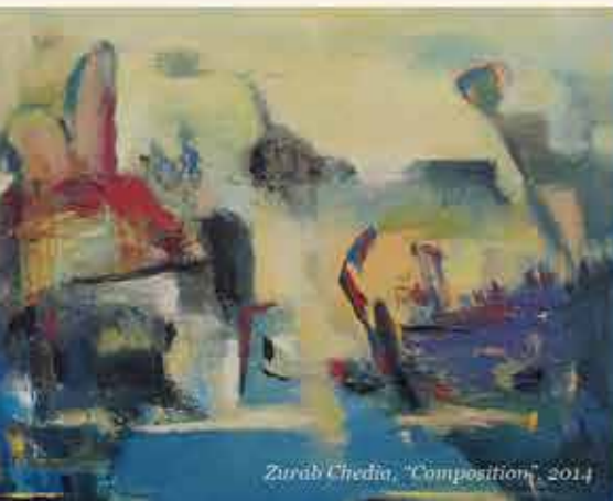
Zurab Chedia, "Composition", 2014

Stichting ArtEcho en Festival IBERIA team betuigen hun dank aan de bovenstaande partners en sponsors.