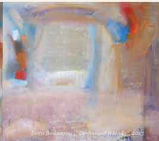
Dato Badzagua, "De laatste brand", 2014