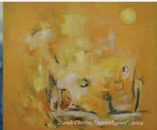
Zurab Chedia, "Apokalypses", 2014