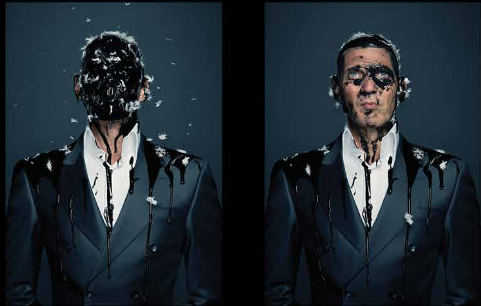
ერვინ ოლაფი, 'კუპრი და ბუმბულები', ავტოპორტრეტი, 2012. ერვინ ოლაფის სტუდია.

Erwin Olaf's art is exhibited in the world's biggest and most prestigious venues.